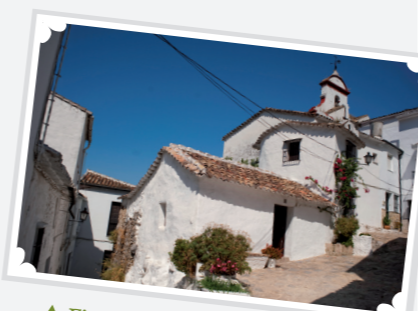
▲ Ejemplo de arquitectura ubriqueña